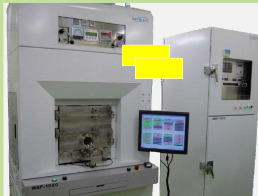
ウエハ to ウエハ接合装置