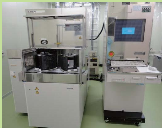
測長SEM (高精度寸法測定装置)