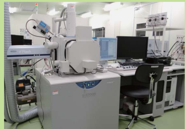
ウエハSEM (MEMS 構造解析分析装置)