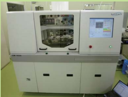
チップ to ウエハ接合装置