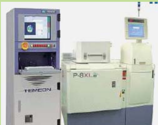
MEMS デバイス 電気的特性評価装置