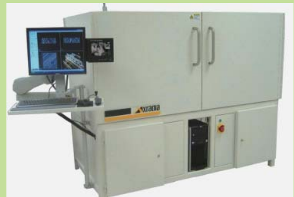
X線 CT 3次元構造観察装置