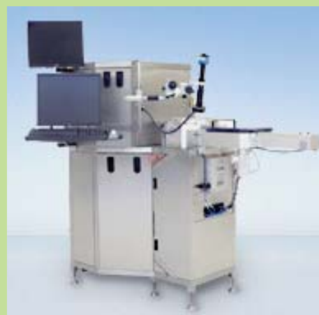
ドライ犠牲層エッチャー 8インチ