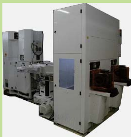
シリコン深掘りDRIE 8、12インチ